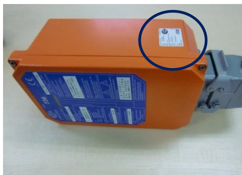
HBC receiver / 受信機