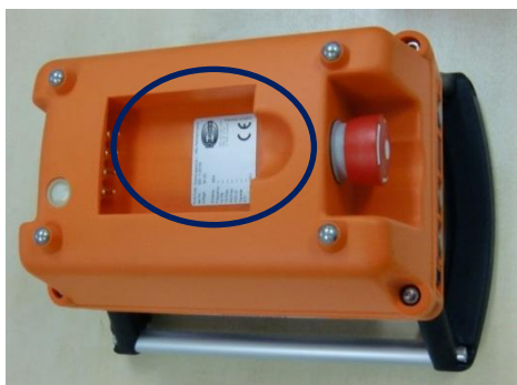
HBC transmitter /送信機